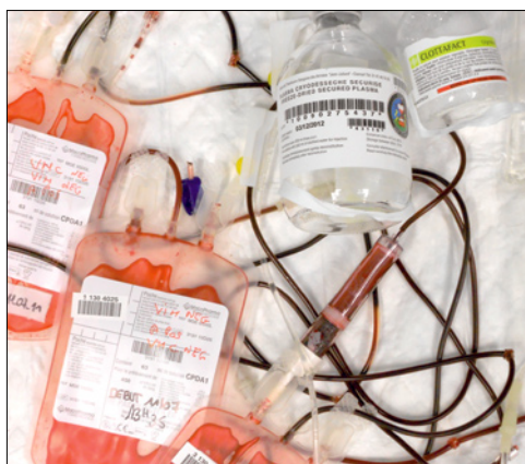
Damage control hémostatique : apport précoce de facteurs de coagulation au cours de la transfusion massive.

plaquettes et de facteurs de coagulation permettrait de prévenir ou de corriger la coagulopathie et serait associé à une réduction significative de la mortalité et des besoins transfusionnels [15-18]. De nombreux trauma centers ont élaboré avec succès des protocoles de délivrance des produits sanguins dans lesquels la banque du sang prépare un premier pack de 6 à 10 CGR de groupe O négatif et 4 à 6 PFC décongelés dès l'annonce de l'arrivée du traumatisé grave. Sur demande de l'équipe de réanimation ou du chirurgien, des packs ultérieurs sont délivrés, qui comprennent le même nombre de CGR, de PFC et d'unités plaquettaires ( six en général ) [12].