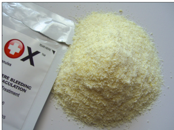
Damage control ground zero : poudre hémostatique Celox®.