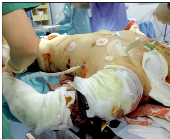
Damage control ground zero : contrôle des saignements extériorisés par garrot tactique

L'hypothermie est aggravée par un remplissage vasculaire excessif par des litres de cristalloïdes. Les effets de la coagulopathie induite par l'hypothermie ( perte de 10 % d'hémostase par degré au dessous de 37°C ) doivent être limités par le réchauffement des solutés et des produits sanguins, l'utilisation de dispositifs accélérateurs-réchauffeurs de perfusion, de couvertures à air chaud pulsé et le réchauffement de l'environnement.