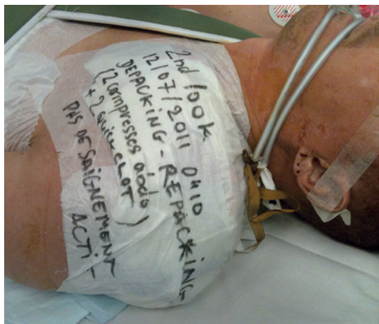
Damage control surgery : fermeture temporaire d'une plaie thoracique avec pansements hémostatiques et compresses laissés en place.