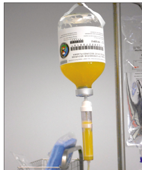
Damage control hémostatique : plasma cryodesséché sécurisé déleucocyté.

Dans les traumatismes hémorragiques, les recommandations actuelles préconisent l'administration initiale de cristalloïdes puis de colloïdes en seconde intention, en respectant les doses maximales recommandées [3] . Les méta-analyses ne trouvent