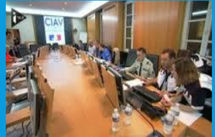
Cellule Interministérielle d'Aide aux Victimes (CIAV)