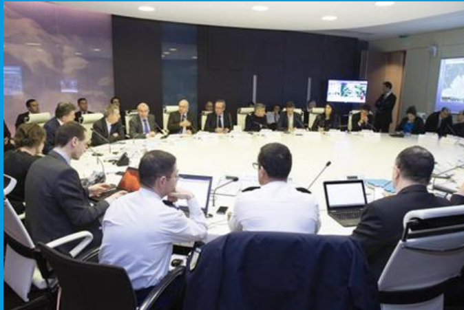
Cellule interministérielle de Crise (CIC)