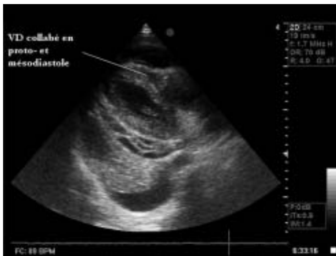
Figure 1. Tamponnade avec épanchement péricardique circonférentiel et collapsus des cavités droites en échocardiographie bidimensionnelle, vue petit axe parasternale (VD = ventricule droit).

sur table. Ainsi, l'induction anesthésique ne se fera qu'en présence de l'équipe chirurgicale au complet, prête à intervenir, c'est-à-dire table chirurgicale préparée, chirurgiens en tenues stériles, champs opératoires installés. En effet, en cas de désamorçage cardiaque à l'induction, il est illusoire de penser que les manœuvres classiques de réanimation seront efficaces. Seule la décompression du cœur réalisée par le chirurgien peut sauver le patient.