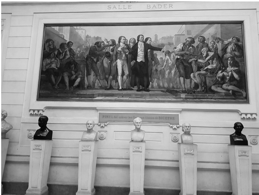
FIG. 3. — Philippe Pinel délivrant les aliénés de leurs fers à Bicêtre (1793). Tableau de Charles Louis Müller. Académie nationale de médecine.