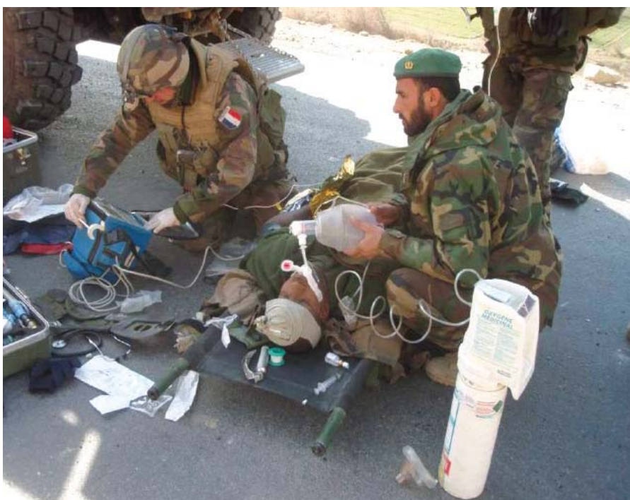
Un blessé afghan pris en charge par un SC3 français.

Afin d'aider le SC 2 et SC 3 dans sa prise en charge du blessé de guerre, souvent dans un contexte de stress, voire sous le feu, il a été créé un moyen mnémotechnique inspiré des protocoles américains. En effet, ces derniers n'ont pas recours à des médecins à l'avant mais à des paramedics , profession à part, se situant entre l'infirmier et l'ambulancier. Spécialement formés aux gestes et à