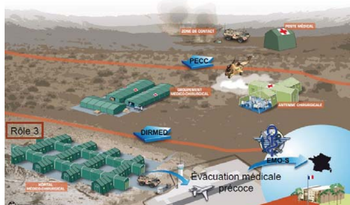
1 : Chaîne Santé en opération extérieure. PECC : régulateur médical du théâtre. DIRMED : Directeur Médical du théâtre (ex COMSANTE). EMO-S : État-major Opérationnel Santé, structure de commandement et de régulation médicale au niveau central (DCSSA).