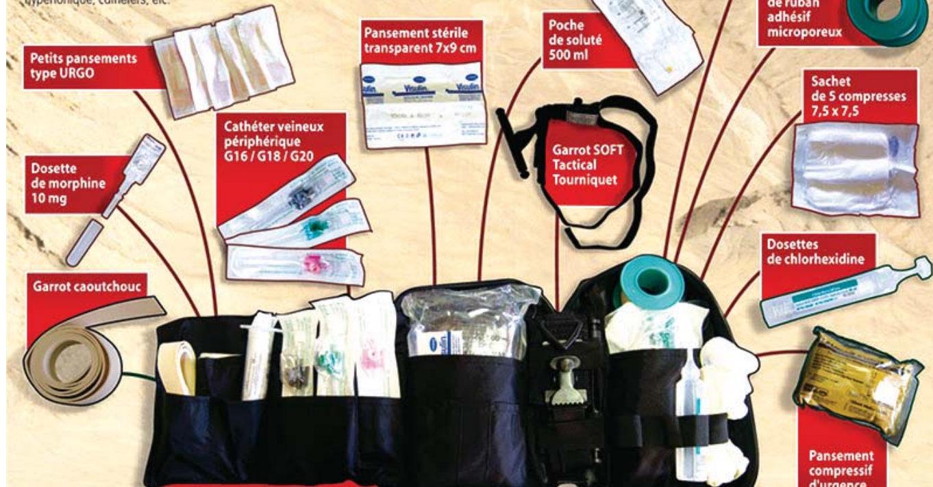
La trousse individuelle du combattant.