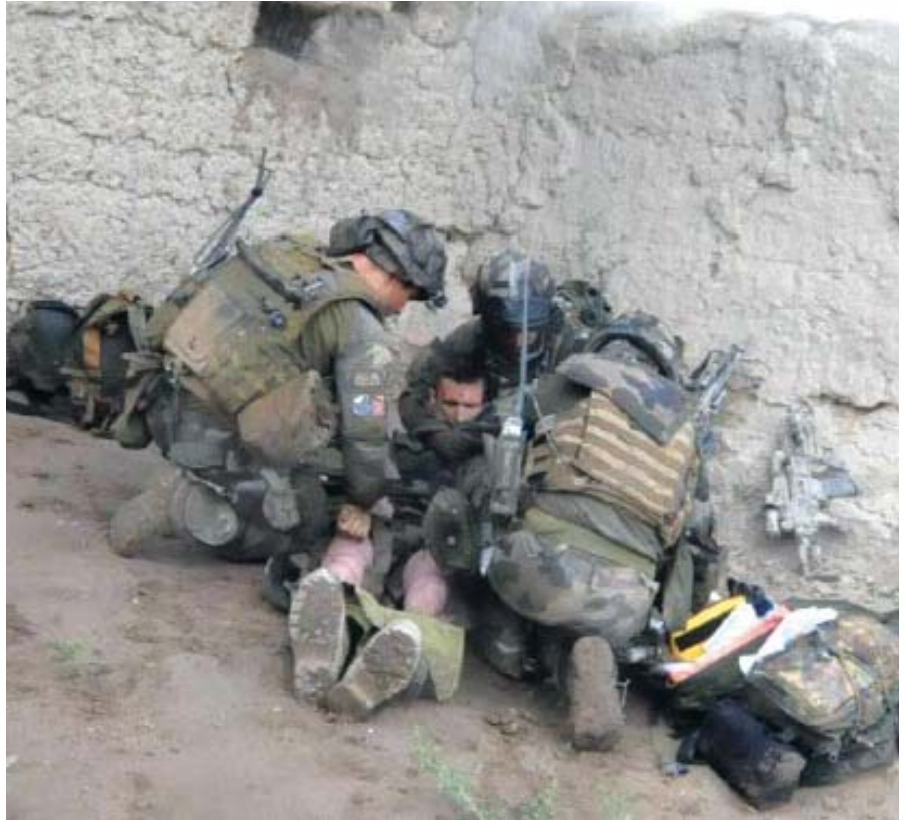
Un légionnaire français pris en charge en Afghanistan par une équipe médicale sous le feu.

Le SC 2 est également formé à prendre en charge une détresse respiratoire en mettant en place une oxygénation au masque voire à poser une coniotomie (voie d'abord trachéale), en cas d'obstruction des voies aériennes supérieures. Il peut également exsuffler un pneumothorax compressif.